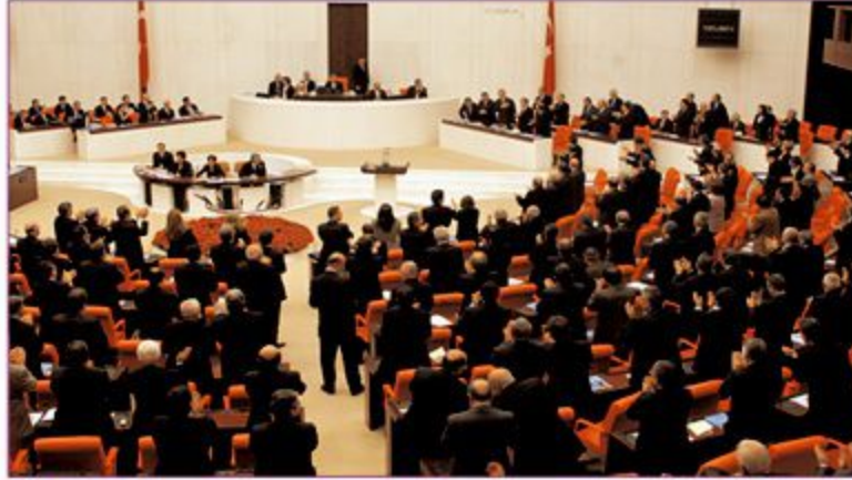
TBMM, yasama kurumudur.

Demokratik rejimlerin uygulandığı devletlerde yasama organı halkın oyu ile seçilen meclislerdir. Ülkemizde yasama organı halkın oyları ile seçilen, millet egemenliğinin temsil edildiği en üstün kurum olan Türkiye Büyük Millet Meclisi' dir. Bu yüzden millet adına yasa yapma yetkisi TBMM'ye verilmiştir.